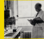
Forschung und Technik

Mod-, Tief- und Straßenbau Schwingungsrechnungen Ingenieurausbildung